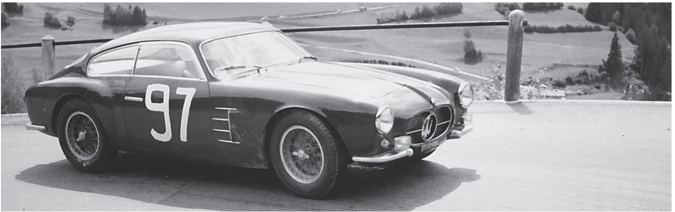
«Ferral» (CH), Maserati 2000 GT Zagato